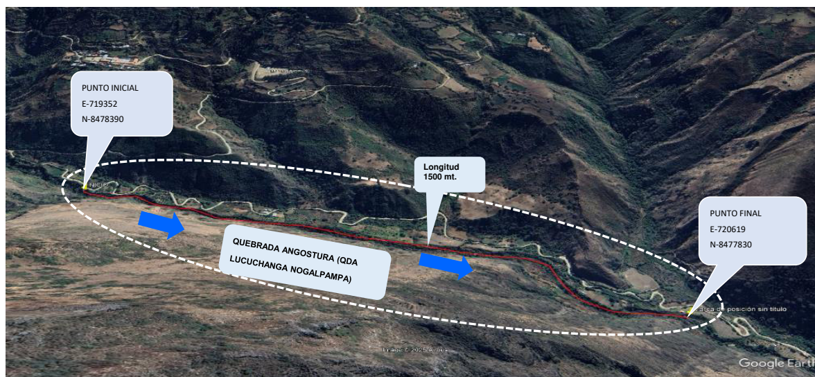
5.- IMAGEN SATELITAL DE ZONA VULNERABLE(GOOGLE EARTH)